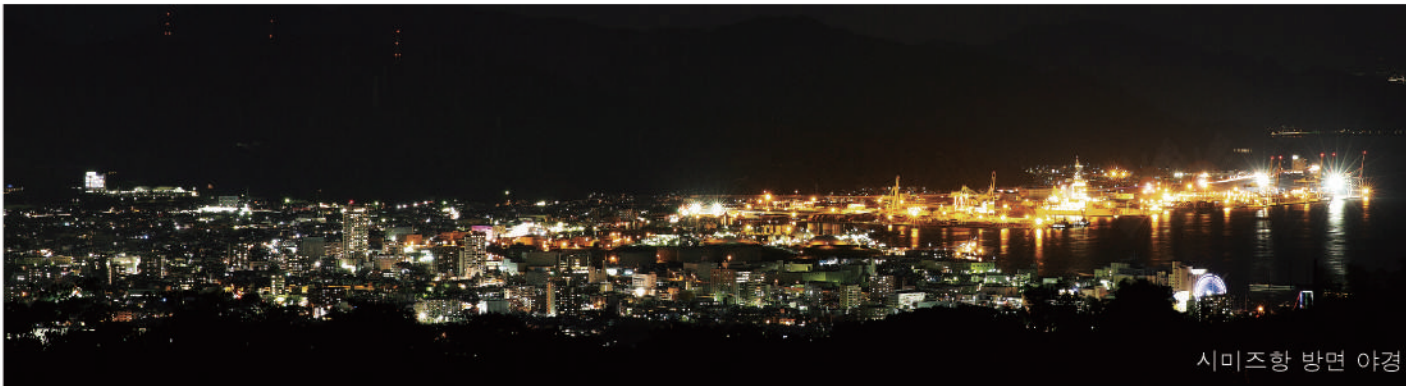
시미즈항 방면 야경